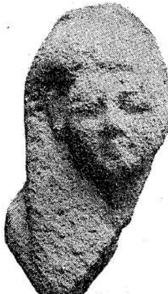
ראש האלה התור: הטעם של הקדמונים