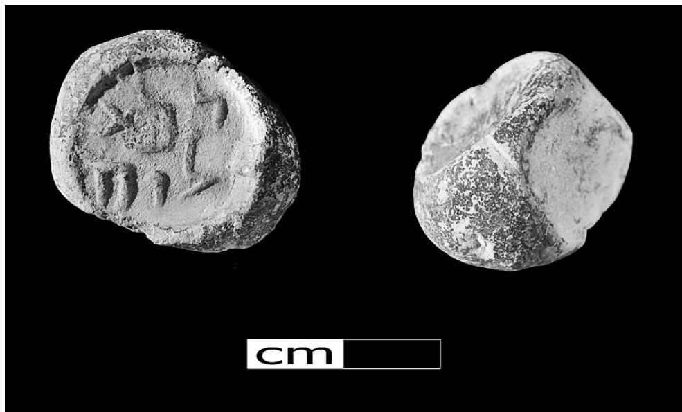
1 החותם - מבט פנים ואחור

בחג החנוכה בשנה שעברה (תשע"ב) דווח על תגלית מעניינת שנתגלתה בשכבת העפר שמילאה את תעלת הניקוז שלמרגלות קשת רובינסון, בחפירות שמנהלת רשות העתיקות בגן הארכיאולוגי בירושלים. 1 מדובר בחפץ קטן עשוי טין, דמוי חותם, בקוטר של כשני סנטימטרים, שעליו טבועות שש אותיות בשתי שורות, שלוש אותיות בכל שורה. החופרים, רוני רייך מאוניברסיטת חיפה ואלי שוקרון מרשות העתיקות, הציגו את החפץ במסיבת עיתונאים ב־25 בדצמבר 2011, והמציאה זכתה לפרסום נרחב בעיתונות הכתובה ובאינטרנט (איור 1). מאחר שאין לי גישה