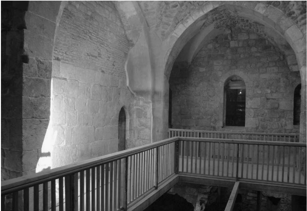
7 חדר ההלבשה של הח'מאם במתחם "אהל יצחק"

להכשרתה כמוקד להתכנסויות באירועים מיוחדים. בקצה הדרום-מערבי של השטח הוכשר שביל מעבר עילי (אפשר שבעתיד יעבור במנהרה מתחת לכביש) העתיד לקשר באופן ישיר בין עיר דוד ובין העופל. בחלקו הדרומי ביותר של השטח מצויים שרידי מבנים מהתקופה הביזנטית שלא זכו עד היום לשימור, המחשה או שילוב במסלולי הביקור. המשך פרויקט המקוואות עתיד לכלול שימור, פיתוח והמחשה של כל השטח המדובר, החוצץ בין מסלול המקוואות לפרויקט "חומות העופל" (להלן). יש לציין כי מלבד הטיפול בשרידי הארכיאולוגיים נעשה מאמץ תכנוני מיוחד לגרום לכך שהמדרכים החדשים יתמזגו בשטח (איור 8). פרויקט "חומות העופל" נועד להציג למבקר את חלקו הדרומי של הגן, בו נחשפו שרידים מתקופת בית ראשון. חלק מהשרידים זוהו על ידי הארכיאולוגית אילת מזר כשרידי שער בחומת העיר. לאור הספקות שהועלו כנגד פרשנות זו לא בוצעו השלמות באבן לשם