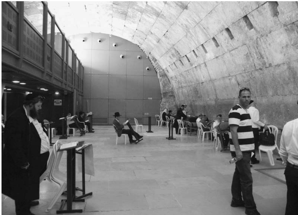
2 אזור קשת וילסון

חפירה, חשיפה ופיתוח תיירותי של אזורי החיץ בין האתרים הגדולים שנחפרו זה מכבר, וכך ליצור רצף ביניהם, או באמצעות יצירת מעברים מודרניים בין האתרים. בנוסף, ניתן ליצור קשר בין מרכזי הביקור באזור זה. מוקדי ביקור תיירותיים אלו (שחלקם קיימים זה מכבר וחלקם עדיין בשלבים של תכנון) כוללים את מנהרות הכותל, המרכז למורשת הכותל, הגן הארכיאולוגי ומרכז דוידסון המצוי בתחומו, הגן הלאומי "עיר דוד" והיכל התנ"ך העולמי המתוכנן בחניון גבעתי, וכן אתרים בתחום המרחב הציבורי הפתוח כגון הטיילת שלמרגלות חומת העיר העתיקה, טיילת בית שלום, טיילת העופל. קשרים רציפים בין מוקדים אלו (בין אם יהיו מעל או מתחת לפני הקרקע), מלבד חשיפת השרידים הארכיאולוגיים המצויים בהם, יאפשרו בעתיד ליצור מסלולים ייעודיים סביב תקופות, נושאים מאפיינים ועוד. באופן זה, ניתן יהיה לחשוף