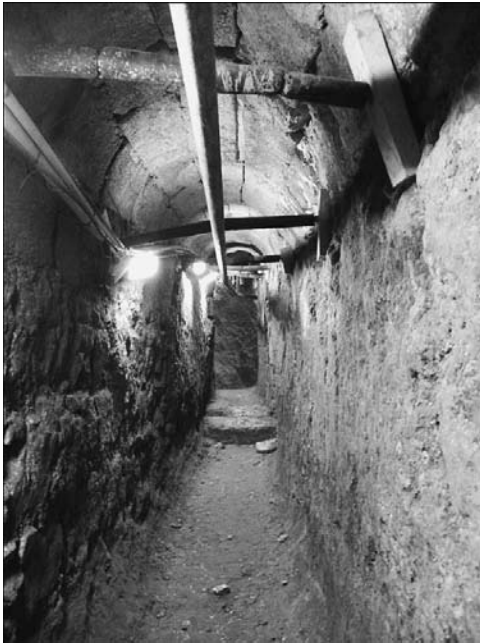
10 תעלת הניקוז מתחת לרחוב ההרודיאני העובר בתוואי הטרופיון

מעבר תיירותי דרך תעלת הניקוז מאפשר, מלבד הצגת התעלה עצמה, גם התוויה של מספר מסלולי סיור בשטח עיר דוד שחלקם עיליים וחלקם מנצלים את השרידים המצויים מתחת לפני השטח. למבקר תינתן האפשרות לבחור נקודות יציאה שונות מן התעלה בהתאם להמשך המסלול: ב"בית היובל", בחניון גבעתי או בפארק הארכיאולוגי (איור 10).