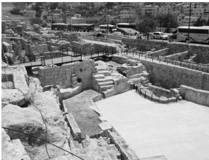
8 עבודות שימור בברכה החצובה הגדולה כחלק ממיזם "מסלול המקוואות" בגן הארכיאולוגי בעופל