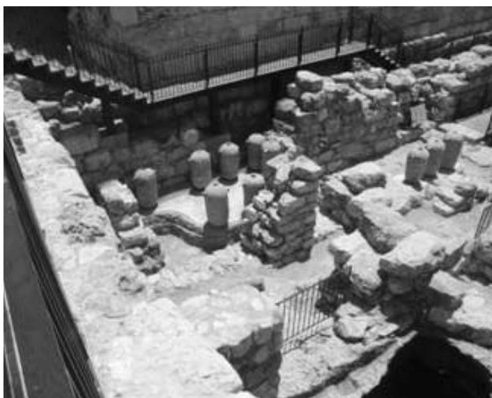
9 קנקני אגירה גדולי מידות (פיטסים) שהוצבו מחדש באזור המזוהה כשער בחלק הדרום-מזרחי של העופל

של אזור העופל שנערך בעבר על-ידי פרופ' טרנר ואדריכל פלסנר. מדרום לעופל, ממזרח לחפירת חניון גבעתי החלה חפירה תחת כביש מעלות עיר דוד במטרה לאפשר גישה לבור מים גדול הממוקם מצפון למרכז המבקרים של היום, וכן ליצור בהמשך חיבור ישיר, תחת הכביש,