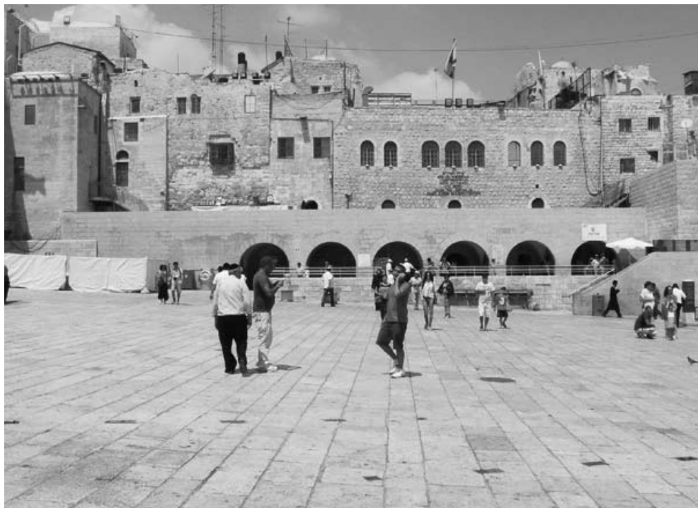
3 מבט על חזית בית שטראוס מצפון לרחבת הכותל

(איור 3) המשמש בין השאר נקודת הכניסה למנהרות הכותל. על-פי התכנית המקודמת זה מכבר על-ידי הקרן למורשת הכותל, בתכנונה של האדריכלית עדה כרמי, הרחבה ופיתוח של בית שטראוס יגדירו טוב יותר את הדופן הצפונית של הרחבה וישדרגו את מערך הכניסה למנהרות. זאת ועוד, גם באזור המשמש לתפילה תחת ה"מחכמה" יבוצעו עבודות פיתוח שישלבו בין הפן הדתי של המקום, כמקום קדוש, לבין השרידים המרשימים המצויים בו, באמצעות הצגה ברורה יותר של הממצאים הארכיאולוגיים באזור קשת וילסון. שילוב מורכב יותר בין הארכיאולוגיה, המרקם העירוני ורחבת הכותל כמקום התכנסות, עתיד להיעשות באזור המערבי של הרחבה, במקום בו מתוכנן להבנות "בית מורשת הכותל". במסגרת חפירות ארכיאולוגיות מקדימות שנערכו באתר, נחשפו שרידים מרשימים ביותר של הקרדו המזרחי