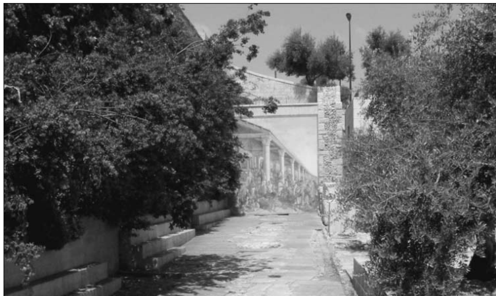
5 חלקו הדרומי של הקדו המזרחי מצפון לשער הבורסקאים