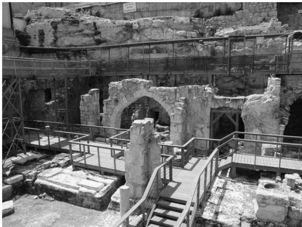
4 שרידים של הקדו הרומי המזרחי שנחשפו ממערב לרחבת הכותל