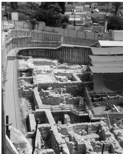
6 חפירות חניון גבעתי, מבט למזרח

כפועל יוצא מהתכנון הכולל בוצעו באתרים השונים במרחב זה מספר פעולות שימור בשנה האחרונה שיפורטו להלן.